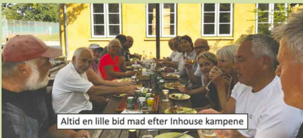
Altid en lille bid mad efter Inhouse kampene