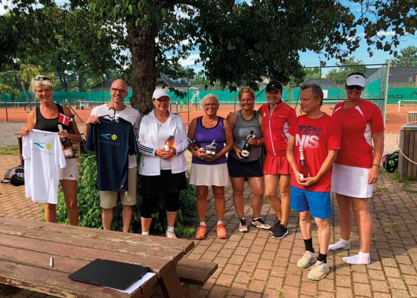
InHouse 2020 - Finaledag